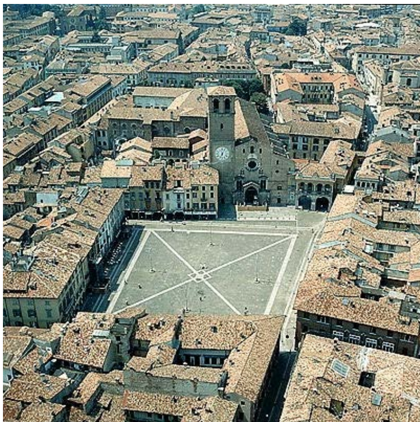
Cuore storico della ... Santuario dell'Incoronata